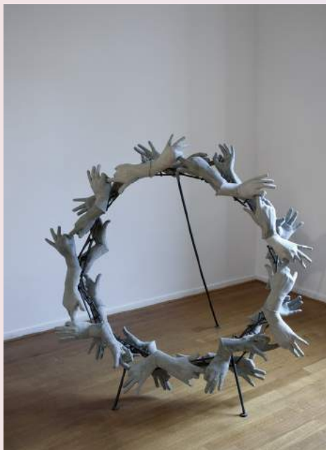
István Csélikámy, Concrete Wreath

Mme Ardi Poels Château de la Borie 87110 Solignac M info@artlaborie.com T 07 85 41 99 55