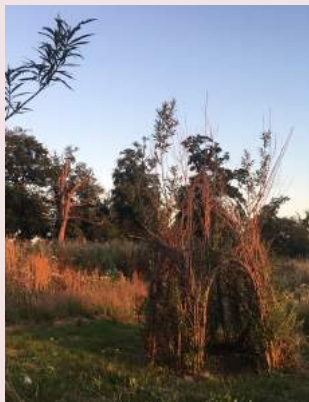
Le jardin de la Borie

de la généralité de Limoges. Le logis citadin de la famille Maledent se trouvait à Limoges, et comme maintes autres familles importantes, elle avait construit une résidence secondaire à la campagne, permettant de fournir la famille en bois, céréales, volailles et autres vivres, et offrant de plus prestige et considération. Nombreuses soirées et parties de chasse furent organisées sur le domaine pour une société élégante.