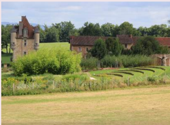
Le jardin avec le Théâtre de Verdure