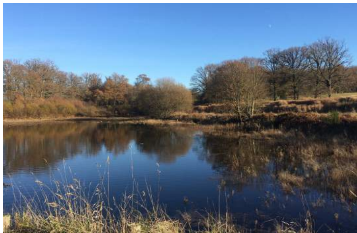
L'étang et les bois du domaine

Le château de la Borie et ses annexes sont entourés de 14 hectares, comprenant un jardin ornemental, un potager, un parc, un étang et des bois qui à chaque saison reflètent la splendeur de la nature. Le domaine de La Borie est en effet situé en pleine campagne, mais est aisément accessible grâce à la proximité immédiate de la ville de Limoges, et notamment de la gare Bénédictins (à 5 km) et de l'aéroport international Limoges-Bellegarde (à 20 km).